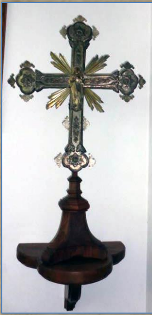
a. Croce Astile del '700 in legno ricoperta in argento sbalzato, da un lato il Cristo, dall'altro la Madonna. Può poggiarsi su ripiano, su basetta a muro, oppure su asta per le processioni. Le dimensioni sono importanti: - con basetta da ripiano cm. 86 - con basetta da muro, cm. 112.