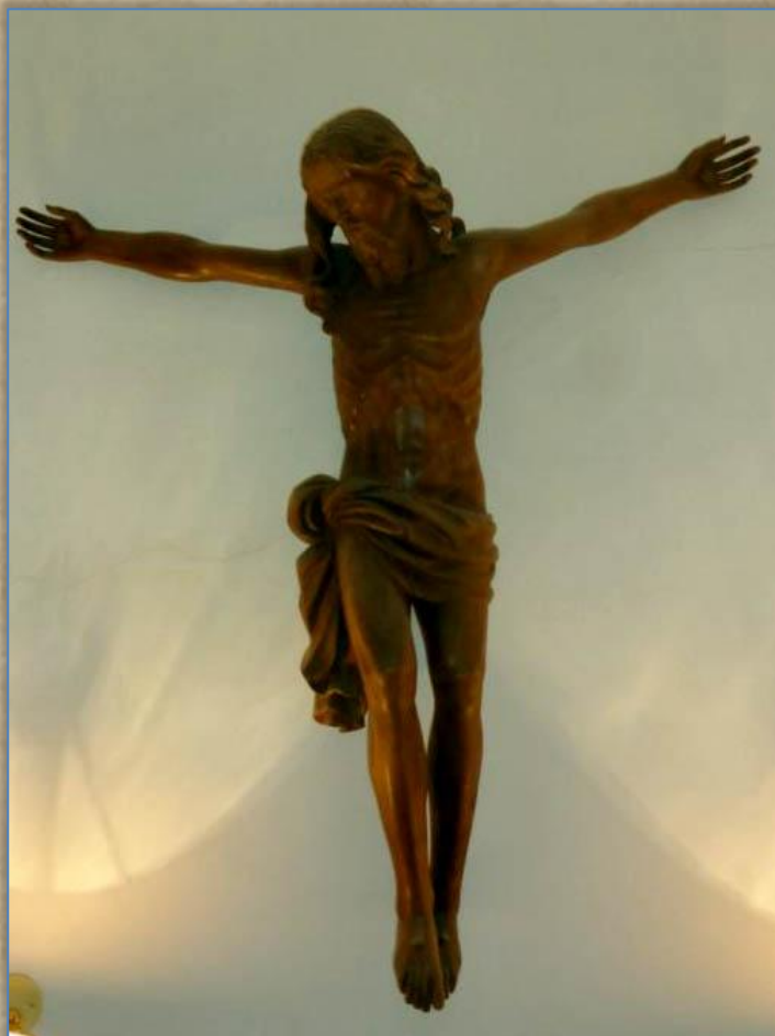
b. Cristo crocifisso, senza Croce opera dello scultore Marco Moroder di Ortisei, che l'ha realizzata, su specifica ordinazione dell'Usai, utilizzando come modello (in scala) una scultura del 1600 (lu Sant' Christ), venata di una atmosfera di mistero in quanto rinvenuta in mare, custodita nella Chiesa della Misericordia di Alghero ed utilizzata esclusivamente per le manifestazioni liturgiche del periodo pasquale nella Cattedrale della stessa città. Le dimensioni sono di cm.110 di altezza e di cm. 100 di larghezza. Trattasi di un'opera di pregevole fatura e di un elevato valore intrinseco.

Considerato che l'unica collocazione possibile che tali doni potrebbero trovare degnamente sembrerebbe l'Abside, il Priore s'è rivolto ad un architetto a noi vicino per studiare se e come porli in modo da valorizzarne anche la portata intrinseca. Si spera di giungere ad una determinazione prima della manifestazione di San Giorgio del 27 aprile.